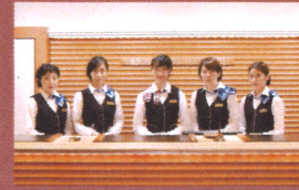
■ フロント 24時間対応