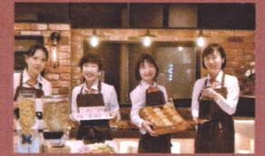
■ レストラン 2F