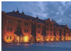
横浜赤レンガ倉庫

壮大な石造りの建物の中、神奈川の文化・歴史資料が先史から現代まで幅広く展示されている。年3回程度、特別展も開催。1階には無料で見学できるフリーゾーンもあります。