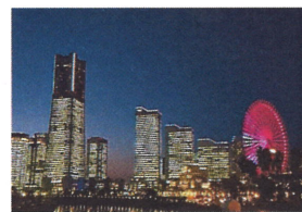
みなとみらい21地区

日本丸と、「歴史と暮らしのなかの横浜港」をテーマにした横浜みなと博物館がある公園。各種催しや年約12回日本丸のすべての帆を広げる総帆展覧が行っています。