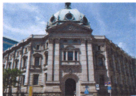
神奈川県立歴史博物館

壮大な石造りの建物の中、神奈川の文化・歴史資料が先史から現代まで幅広く展示されている。年3回程度、特別展も開催。1階には無料で見学できるフリーゾーンもあります。